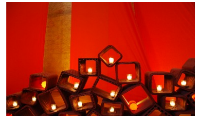
Taizé', Christian Appelsved

Am Freitag, dem 4. 11., möchten wir um 18:00 Uhr zu einer Taizé-Andacht einladen. Geistliche Lieder zum Mithören und Mitsingen, besinnliche Texte und Gebete wollen wir in dieser Stunde in Eschweiler erklingen