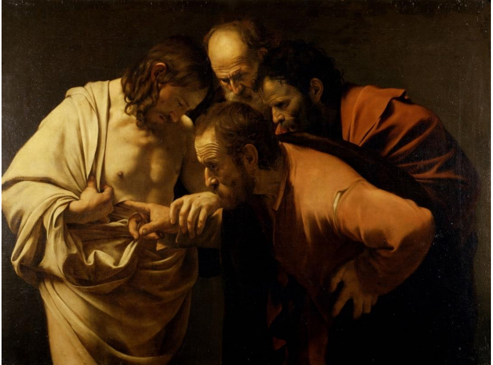
Bild: da Caravaggio, Michelangelo Merisi: Der ungläubige Thomas

Wenn wir jetzt im April öfter mal in den Kalender schauen, können wir beobachten, wie Ostern 2024 immer weiter in die Vergangenheit rutscht. Das Fest ist gefeiert, neue markante Daten tauchen vielleicht im Kalender auf. An dieser Stelle kann man sich schon mal fragen: Warum läuft alles einfach so weiter? Müsste sich nach Ostern nicht alles irgendwie zum Besseren ändern?