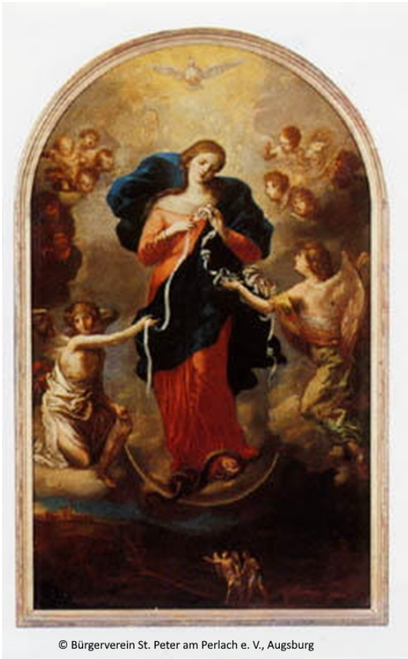
© Bürgerverein St. Peter am Perlach e. V., Augsburg

Tagein tagaus kommen viele Menschen, um vor diesem Bild zu beten. Über die Jahrhunderte hinweg sind es unzählige Menschen, die hier Maria ihre Sorgen und Nöte anvertraut haben. Maria kennt das Leben mit allen Höhen und Tiefen. Sie weiß um Obdachlosigkeit, um Bedrohung des eigenen Lebens durch den König: Maria und Josef und das Jesuskind fliehen nach Ägypten, in ein Land, dessen Sprache sie sicherlich nicht sprechen konnten. Sie kennt die Sorge um den vermissten Sohn nach einer Wallfahrt nach Jerusalem. Sie feiert das Leben und erlebt, wie Jesus dem Brautpaar 600 Liter köstlichen Wein schenkt. Sie befürchtet, dass Jesus sich überarbeitet und keine Zeit zum Essen und Ausruhen hat. Sie erlebt, wie Jesus unzählige Menschen an Leib und Seele heilt und wie er in die Auseinandersetzung mit den Pharisäern und Schriftgelehrten geht. Sie muss miterleben, wie man Jesus einen kurzen Prozess macht und dann