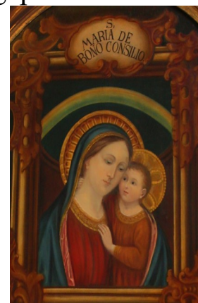
Mutter vom Guten Rat; R. Rosenplänter