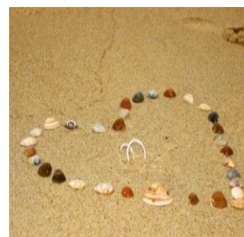
Tanja vom Kolke/pfarrbriefservice

Anmeldeformulare sind in den katholischen Pfarrbüros in Eschweiler erhältlich. In Kürze können sie auch im Internet unter www.katholisch-eschweiler.de heruntergeladen werden.